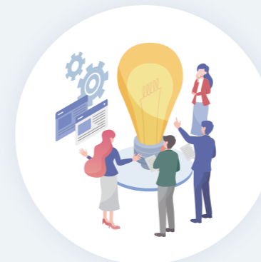
ホームページ、各種コンテンツの診断 新規制作・リニューアル