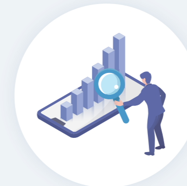
ウェブコンサルティング