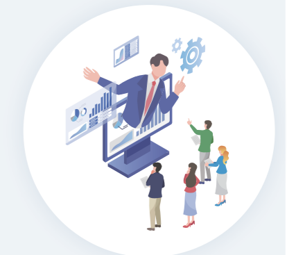
インターネットを活用した集客支援 広告運用の代行