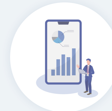
ITツール導入による 業務改善サポート